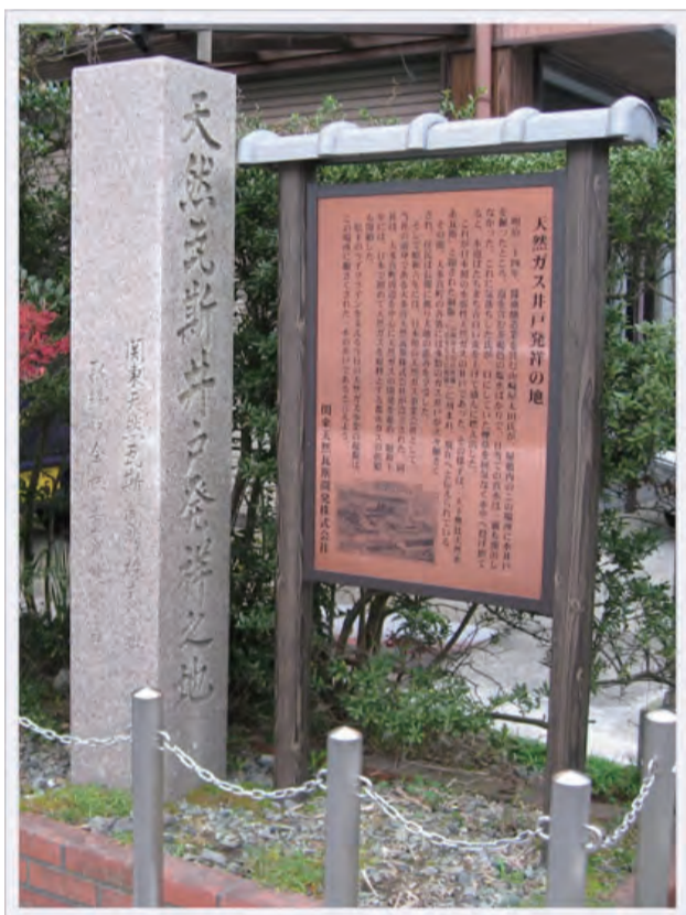
大多喜天然ガス 企業発祥の碑

大多喜駅 10:15 巡回バス乗車→川崎病院 10:18 下車→ 六所神社（虚空蔵堂）→観音寺跡→大多喜ガス発祥の 地→四ツ門跡→大多喜駅 12:30