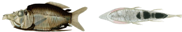
ハイイロヒカリデメニギス（新種その 1）