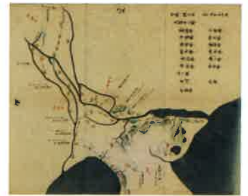
下総一国之図（船橋市西図書館蔵）