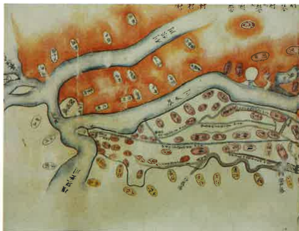
[江戸川付近村々の図] (部分) (船橋市西図書館蔵)