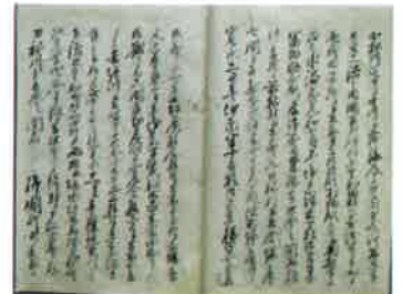
寛政五年 治河言上之案文写(複製) (原品は個人蔵)