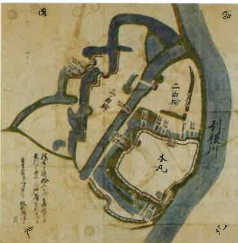
関宿城破損修復願絵図(笠間稲荷神社蔵)