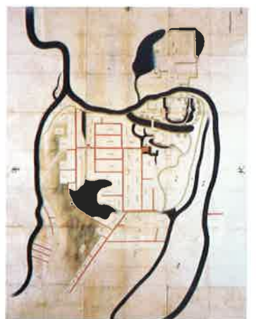
諸国城郭絵図のうち下総国世番宿城絵図(複製) (原品は国立公文書館蔵)