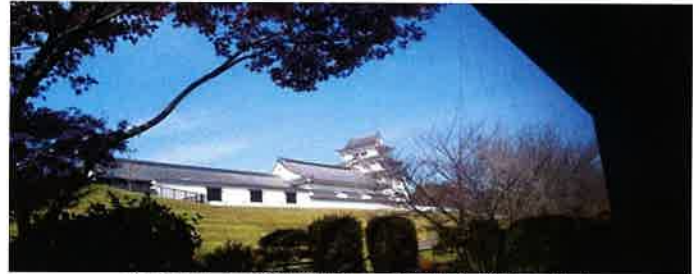
食事をしながら窓越しに関宿城が見えます。