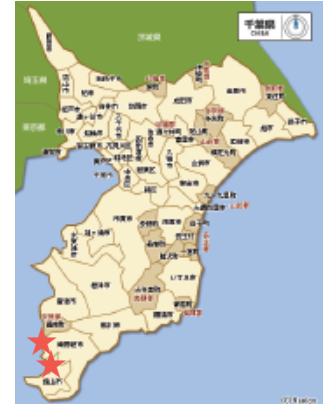
図1. 東京湾外湾にあたる房総半島の採集場所（赤い星印）。

論文：Komai, T. 2015. A new species of the snapping shrimp genus Alpheus (Crustacea: Decapoda: Caridea: Alpheidae) from Japan, associated with innkeeper worm Ikedosoma elegans (Annelida: Echiura, Echiuridae). Zootaxa 4058: 101–111. http://dx.doi.org/10.11646/zootaxa.3793.1.5