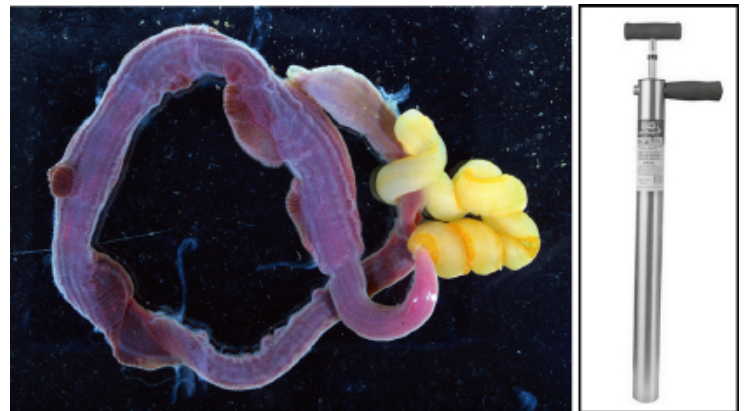
図3左、ユメユムシテッポウエビの宿主ユメユムシ。伸ばすと体長40 cmを超えます。右、採集器具のヤビーポンプ。長さは75 cmのものを使用。