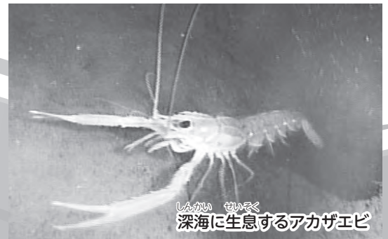
深海に生息するアカザエビ