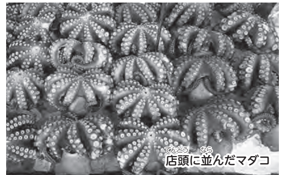
店頭に並んだマグロ