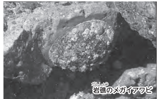
岩礁のメガイアワビ