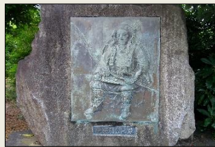
平 将門 像(レリーフ)