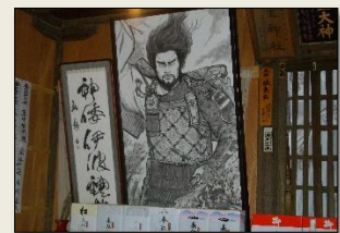
平 将門 絵