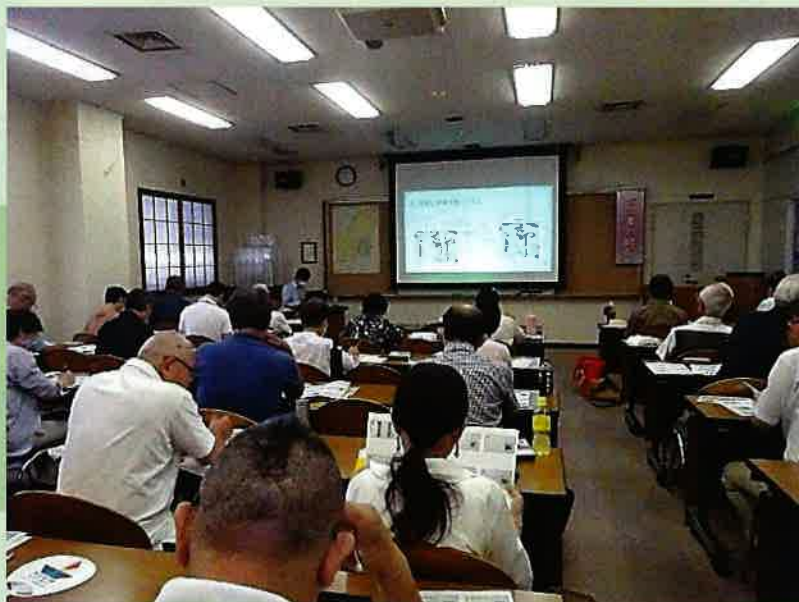
初級編第1回目の講座の様子