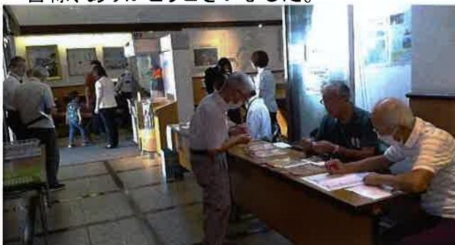
「友の会」受付の様子