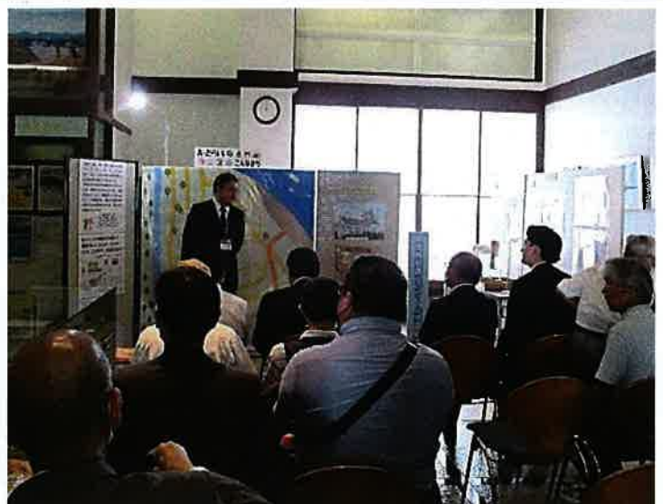
オープニングセレモニーの様子(エントランスにて)