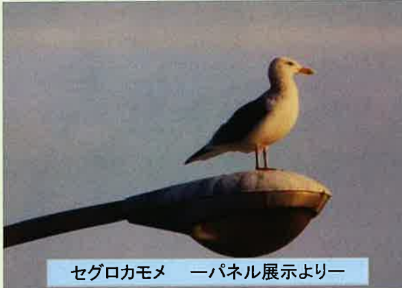
セグロカモメ ーパネル展示よりー

「川辺の鳥たち」は、6月26日に終了しました。 ご来館者多数。ありがとうございました。 海のカモメが境大橋まで飛んで来ているのに 驚きました。