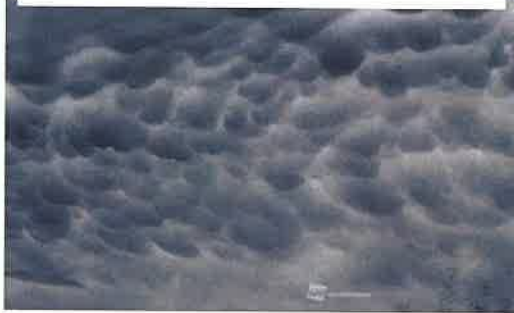
2020/07/08 13:43 ウェザーニュース