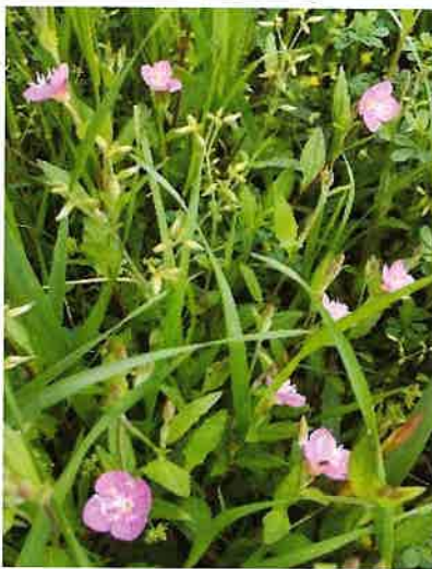
関宿城東側で

← 関宿城博物館の周囲には 沢山の草花が咲いています。 東側の塀沿いに小さなピンク の花を目にしました。