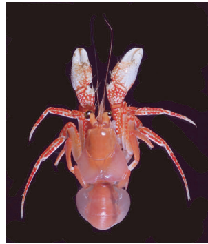
図2. 同上。スナギンチャクを脱がせた状態。本種は南日本(九州パラオ海嶺、南大東島沖)、南シナ海、フィリピン、インドネシア、ニューカレドニア、オーストラリア東岸、水深136-1125 m に分布。