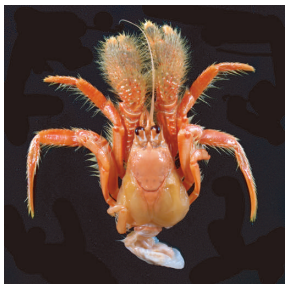
図3. Paguropsis andersoni (Alcock, 1899). フィリピン、インドネシア、インド、マダガスカル、アフリカ東岸、水深30-594 m に分布。インドのケララ産の標本。千葉県立中央博物館所蔵。