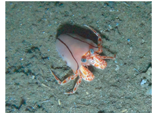
図9. 南アフリカのダーバン沖で ROV により撮影された P. confusa の生体。体の大半がスナギンチャクによりすっぽり被われているのが分かります。

キンチャクヤドカリの仲間が共生するスナギンチャク類については種がまだ確定されていません。キンチャクヤドカリの仲間は袋状になったスナギンチャク群体内側の縁近くをハサミ状の第 4 脚脚（図 10, 11）でしっかりとつかみ、サスペンダーでひっぱりような形でスナギンチャクをはいています（図 2、9）。ヤドカリ類はゾエアと呼ばれるプランクトン幼生期を経て成体になるので、キンチャクヤドカリの仲間も最初からスナギンチャクをはいているわけではありません。いつ、どこで、どうやってパートナーとなるスナギンチャクを見つけるのか、などいまだに分かっていません。ヤドカリ類は巻貝をはじめとしていろいろな素材を宿として利用しますが、キンチャクヤドカリのようにスナギンチャク類を直接はくようにして利用するという例は他のヤドカリ類では知られていません。このような特殊な生態がどのように進化したのかなど、興味は尽きません。