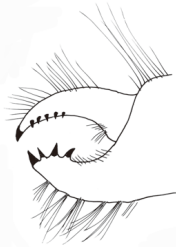
図11. キンチャクヤドカリの左第4脚脚の指部。咬合線にはトゲがあり、スナギンチャクをしっかりつかむことができるようになっているのが分かります。でも、スナギンチャクは痛くないのかな？