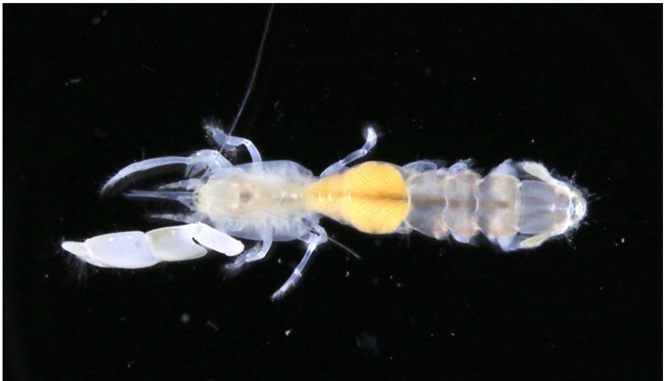
写真：新種として記載した「ワカサスナモグリ Callianassa ogurai 」

本成果は、2022年9月8日（現地時刻）にニュージーランドの国際学術誌「Zootaxa」にオンライン掲載されました。